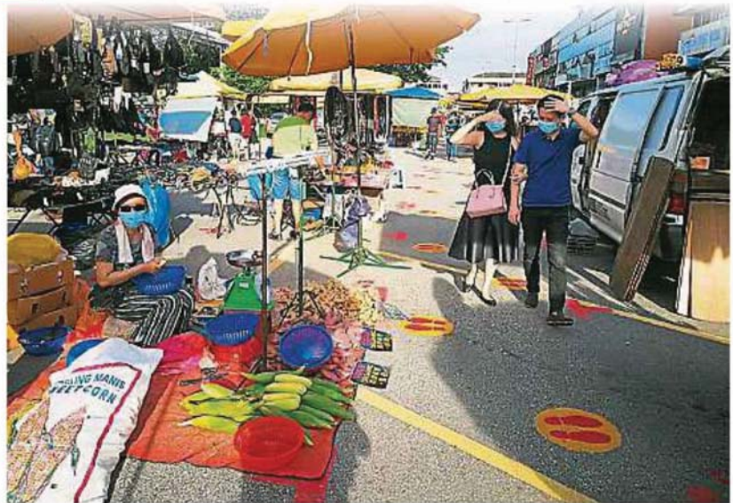
SS2夜市复业后，档口数量减半，人潮也不多。