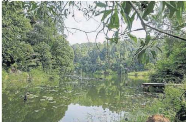
■U10区柏兰岭高原环境优美。

“越来越多森林为让路发展而被夷平的情况，令人失望，我们担心情况持续，将影响当地人民的生活质量，甚至会为此而失去当地生态系统中的野生动植物。”