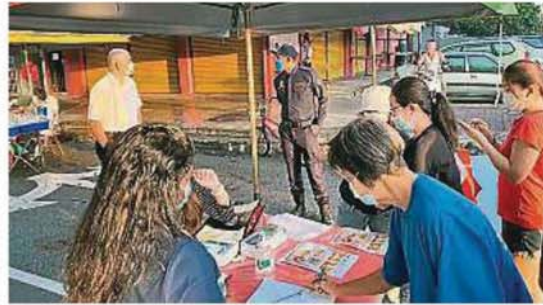
瓜冷市议会执法人员在临时早市小贩摆卖地点入口处“把关”，确保所有进入购物者都必须先登记和遵守标准作业程序。