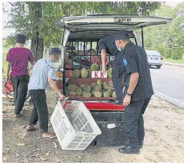
■在路边非法卖榴槤也不被允许。