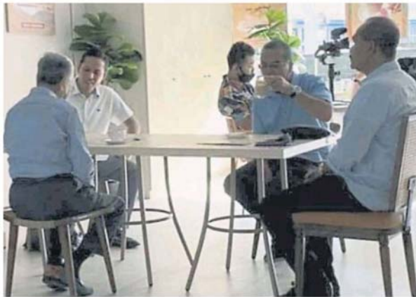
阿布巴卡 (右) 当天早上陪伴马哈迪 (左) 在浮罗交怡的 The Loaf 面包店用早餐并见客。