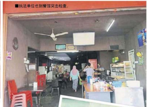
■执法单位也到餐馆突击检查。