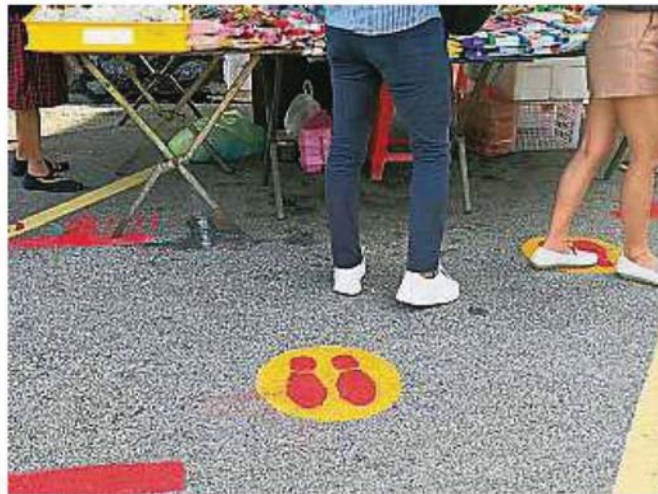
八打灵再也市政厅在摊位前画上排队的脚印，让民众保持社交距离。

Provided for client's internal research purposes only. May not be further copied, distributed, sold or published in any form without the prior consent of the copyright owner.