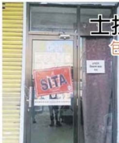
■相信是由外劳经营，执法员也查封了理发店。