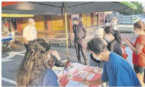
瓜冷市议会执法人员在临时早市小贩摆卖地点入口处「把关」,确保所有进入购物者都必须先登记和遵守标准作业程序。

掌管地方政府事务的雪州行政议员黄思汉将于明天(本月23日,星期二)上午8时30分,莅临万津直落崑崙路早市巡视及了解该早市重开的情况。万津区州议员刘永山届时亦将陪同。