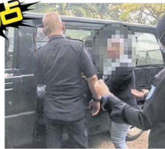
■执法员把涉及非法营业的业者带走。

“只要是违例，我们将撤销商业执照及查封。” 公关强调，该会不会给予口头警告，而是直接开罚单及充公商业物品，包括没有执照的小贩或外劳的交通工具。