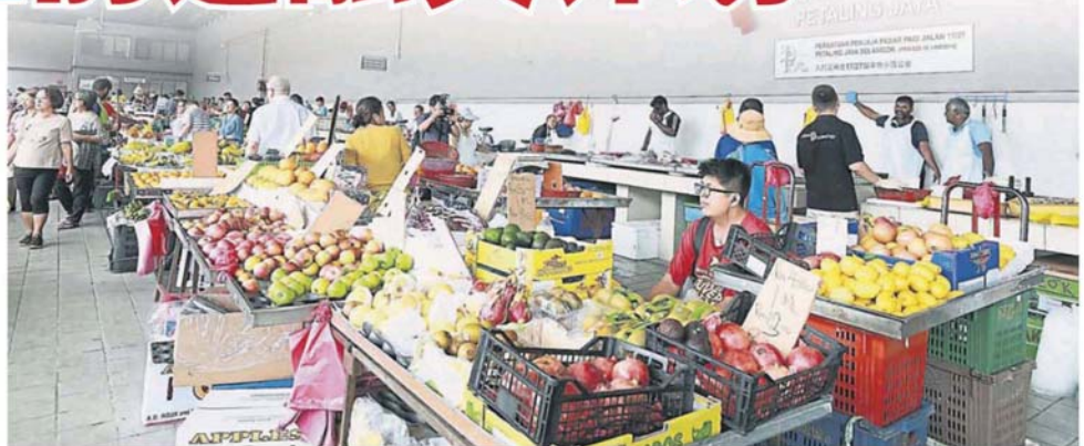
州政府再给予租借地方政府建筑的小贩和商家享有豁免 5 月份的租金优惠。(档案照)

“所以，州政府决定推出按回教融资系统推行的‘雪州前进’融资计划，以帮助中小企业取得现金流来推动短期业务的发展，这也有助于保障相关企业得以在未来获延续经营。”