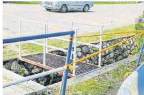
由大路旁改换至店前路巷,所有街线,不准通行或进入。

(万津22日讯)瓜冷市议会今天开始允许让万津直落崑崙路早市复业,不过今早到场摆卖的小贩仅有36名,而市议会所批准复业的早市小贩是55名。