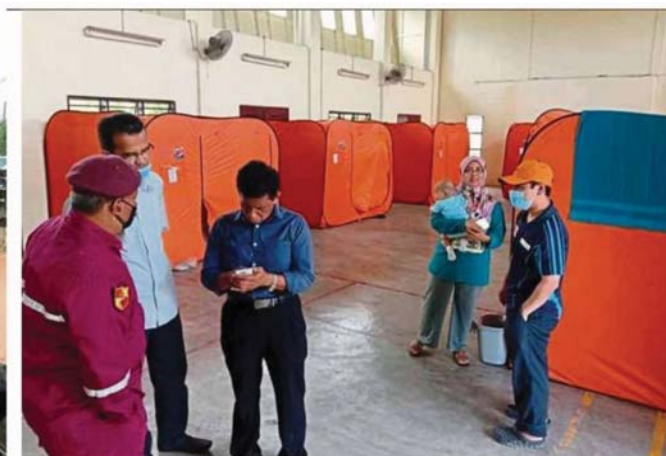
A villager uses a narrow wall ledge as a dry path to his home in Kampung Labu Lanjut that was inundated by floods. (Right) Dewan Orang Ramai Kampung Labu Lanjut is one of the flood evacuation centres.