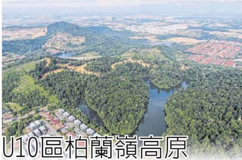
主在土地上展开工程。 ■沙阿南市政厅指已批准发展准证，允许有关地