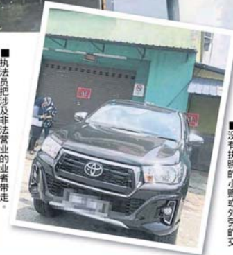
■工具，也会被充公。 没有执照的小贩或外劳的交