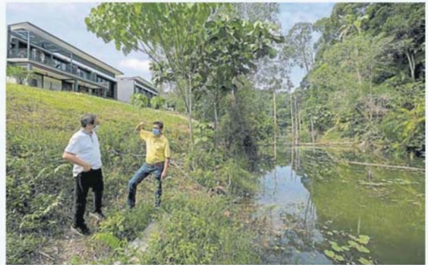
居民指被开发的森林处。

此外，大马环境之友发言人受询时强调，任何森林被开发，不该在没有咨询居民情况下批准，并伤心许多森林在发展名义下被清理，动