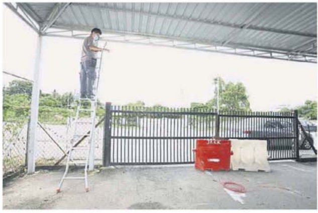
■市議會撥款為巴利屋簷安裝4台閉路電視器材，杜絕非法傾倒垃圾的現象。

她说，泊車場過去沦为非法丟垃圾的場 所，經常有人將大型垃圾包括沙发非法丟 棄在当地，而这些垃圾都是来自万宜和加 影地区，市議會每個月都需為泊車場清理2