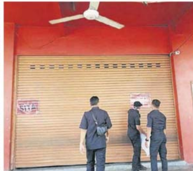
■加影市议会周日在万宜士拉曼工业区，查封了4所包括由外劳经营的商店。