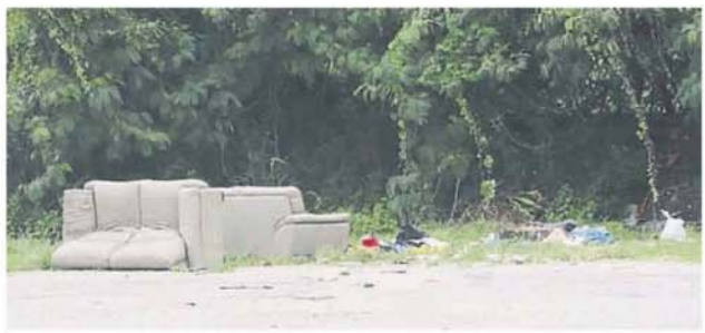
■泊車場与土地隔鄰的範圍，沦为非法丟垃圾的地点。