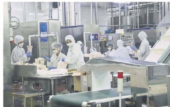
■原本计划在2020年推出的“无拉港工业旅游”,因碰上冠病疫情而受阻,如今已逐步恢复,现阶段已有5至6家工厂参与计划。